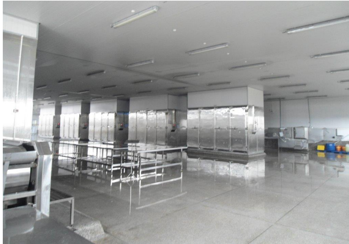
Khu cấp đông tại CTCP TS Thanh Bình Đồng Tháp