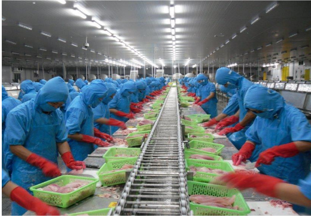
Khu sửa cá tại xưởng 1 CTCP TS Thanh Bình Đồng Tháp